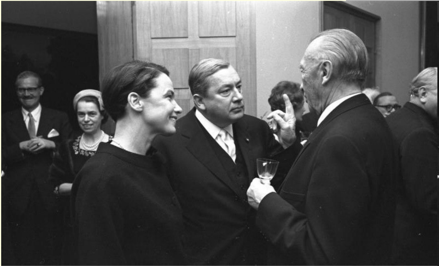
12. Dezember 1962