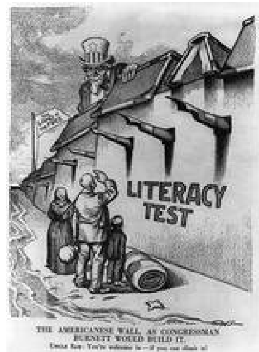
Obr. z r. 1916 (USA)